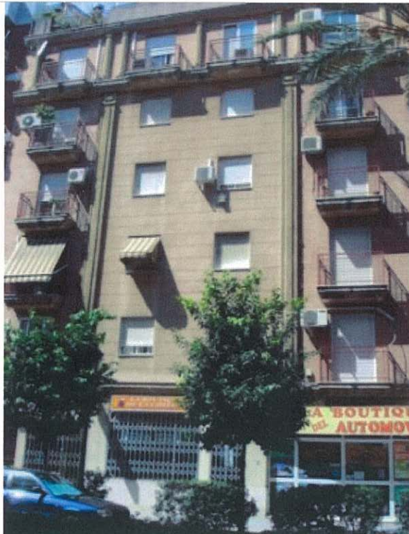
Fachada principal Paseo de la Independencia