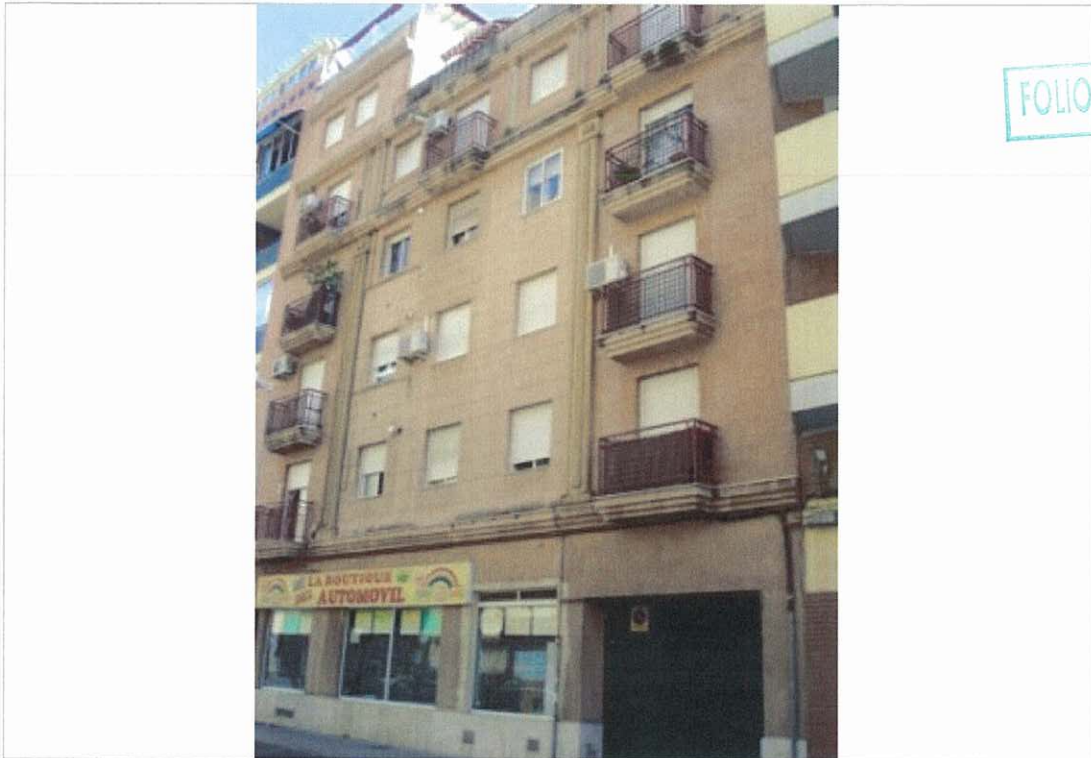
Fachada posterior Avda. de Alemania