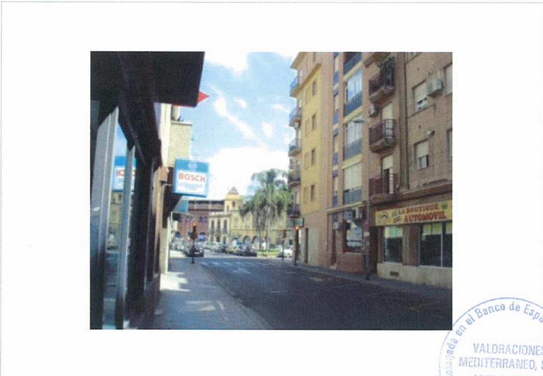
Vista general Avda. de Alemania