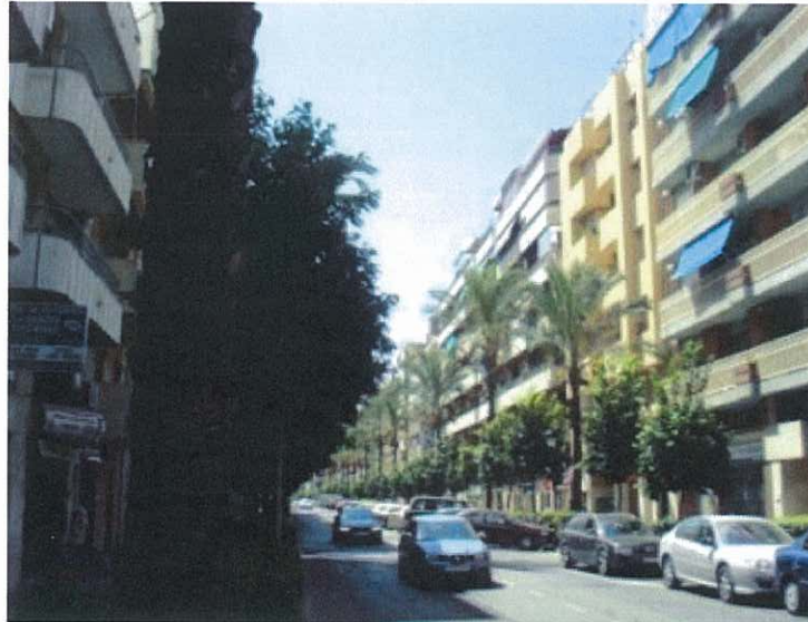
Vista general Paseo de la Independencia